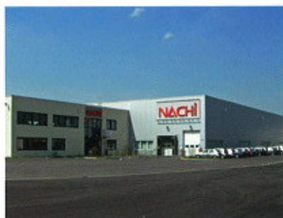
▲ NACHI EUROPE GmbH / NÉMETORSZÁG