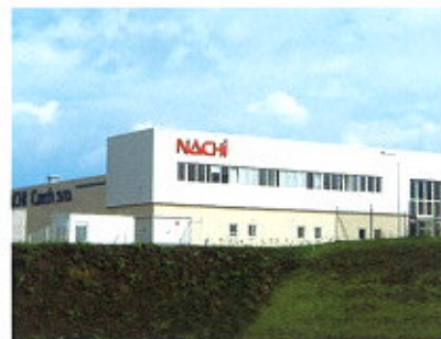
▲ NACHI CZECH S.R.O. / CSEH KÖZTÁRSASÁG