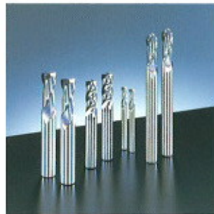
▲ GS sorozatú marók