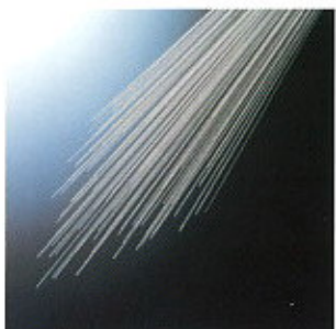
▲ „Micron Hard” ultra-finom huzalok

Mind keménységben, mind alakban illeszkednek a felhasználási célokhoz, ezáltal javítva a költség-viszonyokat.