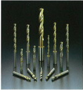
▲ SG-ES (ESS) fúrók

A standard fúróktól egészen a nagy pontosságú és nagy teljesítményű fúrókig terjedő teljes termékkör, ami minden felhasználási célnak megfelel.