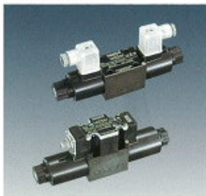
▲ Szolenoid szelep