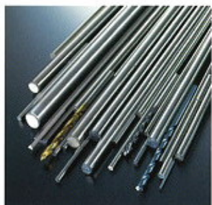
▲ „Pre-harden” edzett rudak