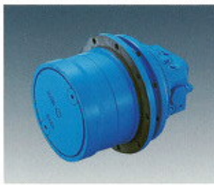
▲ Kerekes motor