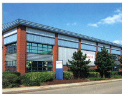
▲ NACHI EUROPE U.K. BRANCH / NAGY-BRITANNIA