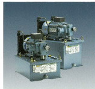
▲ Kompakt hidraulikus egység