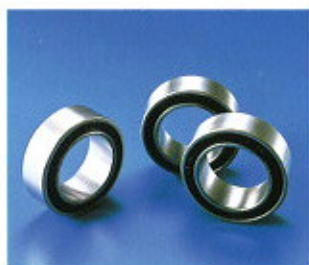
▲ Csapágyak gépkocsi légkondicionáló berendezésekhez