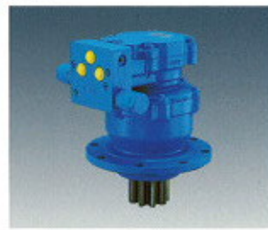
▲ Gémforgató motor