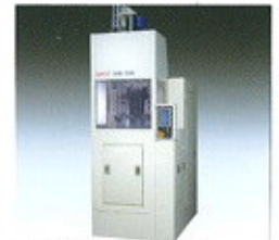
▲ MQL üregelő gép MQL = minimális mennyiségű Kerés = kenőkötős forgácsoló megmunkálás