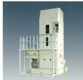
▲ NC ferdefogazó üregelőgép