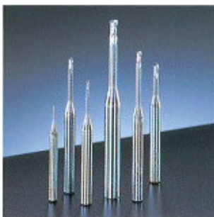
▲ „Az Öntömester” (Mold Meister)