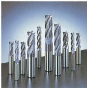
▲ AG sorozatú marók

Szármaró sorozatunk kielégíti a szerszámok és géprészek által támasztott, magas teljesítményű megmunkálási követelményeket.