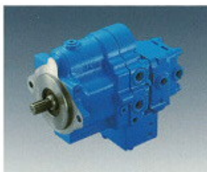
▲ Változtatható dugattyús szivattyú