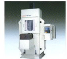
▲ NC precíziós hengertőgépek