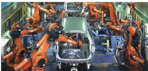
▲ Ponthegeztés az autógyártásban

Rugalmas reagálás a legkorszerűbb műszaki szintet képviselő gyártósoraink iránti minden érdeklődésre. Rakodás / ponthegeztés / ívhegesztés / ultra-nehéz terhek rakodása