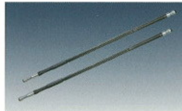
▲ MQL üregelés

A világ vezető üregelő-szerszámai és üregelőgépei. Üregelő termékek széles választéka, üregelés a hornyolattól a nagy átmérőjű ferdefogazású és karácsonyfához hasonló alakokig, üregelőgépek 30KN-tól egészen 500KN-ig.