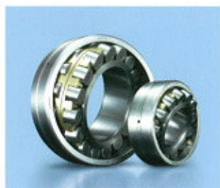
▲ Önbeálló görgőscsapágyak