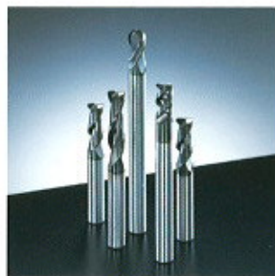
▲ DLC sorozatú marók