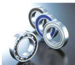
▲ Gyűrűs golyóscsapágyak