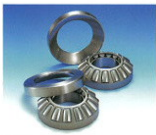
▲ Görgős támcsapágyak