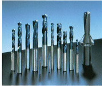
▲ AQUA sorozatú fúrók