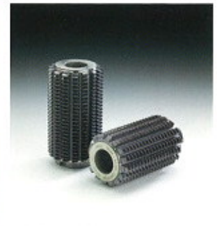
▲ Kettősélű lefejtő marók