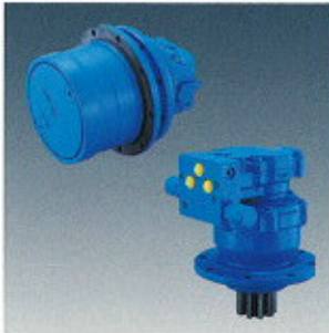
▲ Wheel Motor/Swing Motor ▲ Radmotor/Schwingmotor