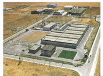
▲ NACHI INDUSTRIAL, S.A. /SPAIN