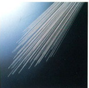
▲ Ultra-fine wires "Micron Hard" ▲ Ultrafeiner Draht „Micron Hard“

Optimale Kosteneffizienz durch genaue Abstimmung von Härte und Form auf den konkreten Anwendungsfall.