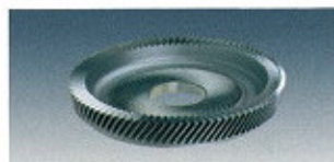
▲ Shaper Cutter ▲ Schneidrad