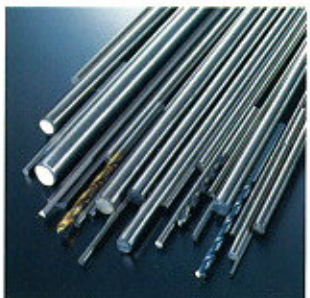
▲ Hardened Rods "Pre-harden" ▲ Gehärtete Stäbe „Pre-harden“