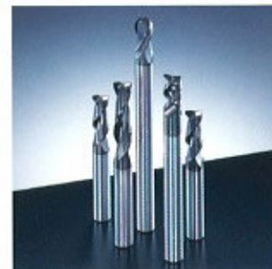
▲ DLC Mill Series ▲ DLC-Fräser-Serie