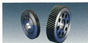
▲ Shaving Cutters ▲ Schaberräder