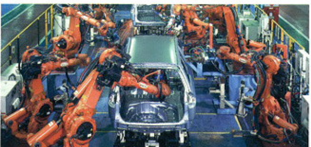
▲ Spot Welding in Car Production ▲ Punktschweißen bei der Automobilfertigung

Flexible Anpassung an die Anforderungen komplexer Fertigungslinien. Handhabung/Punktschweißen/Lichtbogenschweißen/ Handhabung ultraschwerer Lasten