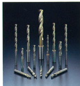
▲ SG-ES (ESS) Drills ▲ Bohrer SG-ES (ESS)