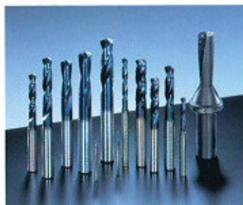
▲ AQUA Drill Series ▲ Bohrerreihe AQUA

Von Standardbohrern bis zu Hochpräzisions- und Hochleistungsbohrern – wir liefern das komplette Sortiment für alle Anwendungsfälle.