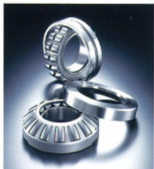
▲ Spherical Roller Bearings/ Spherical Roller Thrust Bearings ▲ Pendelrollenlager/ Axial-Pendelrollenlager