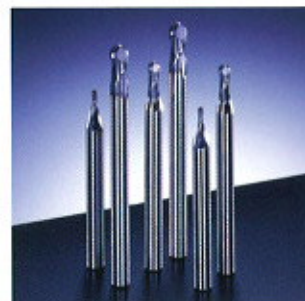
▲ Mold Meister ▲ Mold Meister