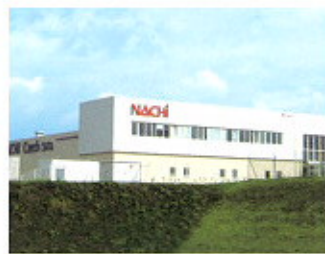
▲ NACHI CZECH S.R.O /CZECH