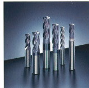
▲ AG Mill Series ▲ AG-Fräser-Serie