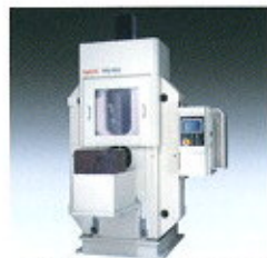
▲ NC Precision Rolling Machine ▲ NC-Präzisions-Walzmaschine