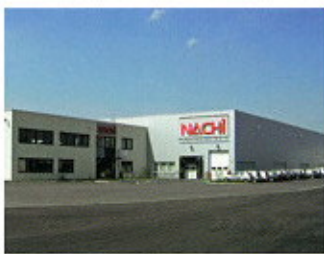
▲ NACHI EUROPE GmbH /GERMANY