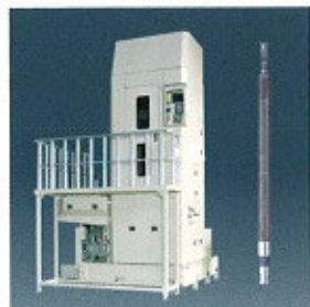
▲ NC Helical Broaching machine ▲ NC-Schnecken-Räummaschine

Weltweit führende Räumwerkzeuge und Räummaschinen. Die umfangreiche Palette unserer Räumprodukte umfasst Räumwerkzeuge von Keilnutziehmessern bis hin zu großen Schnecken- und Tannenbaumformen sowie Räummaschinen von 30 bis 500 kN.