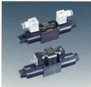
▲ Solenoid Valve ▲ Magnetventil