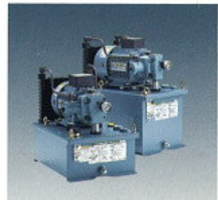
▲ Compact Hydraulic Unit ▲ Kompakte Hydraulikeinheit