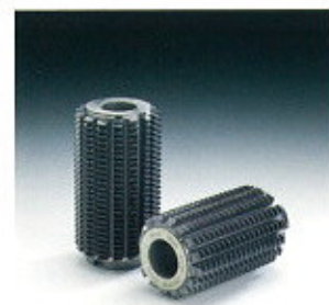
▲ Dual Cut Hobs ▲ Doppelschnitt-Walzfräser

Wir bieten Verzahnungswerkzeuge für jeden Bedarf und besitzen umfangreiches Know-how für Zahnräder jeder Art im Kraftfahrzeug oder in anderen Maschinen.