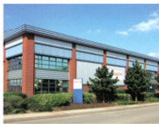
▲ NACHI EUROPE U.K. BRANCH /U.K.