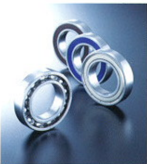
▲ Deep-groove Ball Bearings ▲ Rillenkugellager