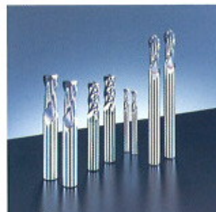
▲ GS Mill Series ▲ GS-Fräser-Serie

Unserer Schafffräser-Serie ist für die hohen Bearbeitungsanforderungen für Werkzeug- und Maschinenteile ausgelegt.