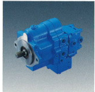
▲ Variable Piston Pump ▲ Kolbenverstellpumpe